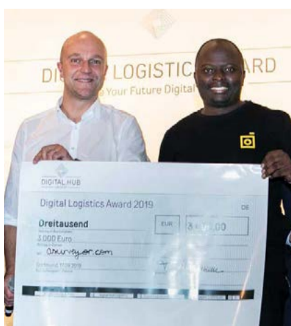
Hightech made in Afrika: Das Start-up asurveyor.com aus Kapstadt belegte 2019 den dritten Platz beim Digital Logistics Award.

Dieser Anteil könnte sich in diesem Jahr noch erhöhen. Denn die Award-Verantwortlichen haben einen mit 5.000 Euro dotierten Sonderpreis für „Smart Logistics in Africa“ ins Leben gerufen.